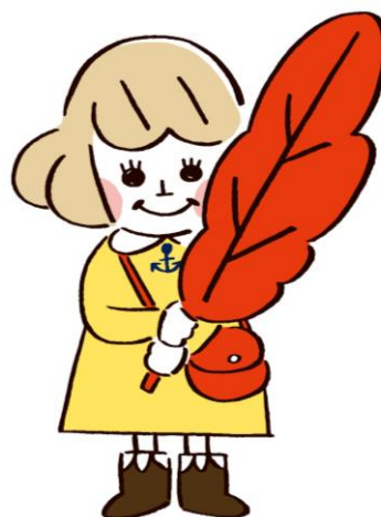
共同募金ロゴマーク