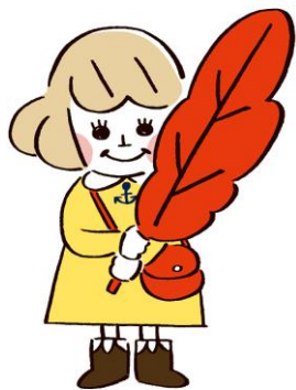
あかはねちゃん