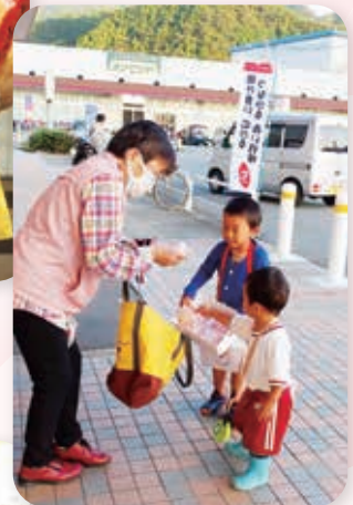
募金活動の様子（神河町）