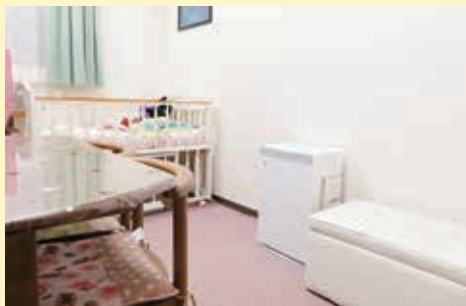
白鷺園母子生活支援施設 (姫路市)