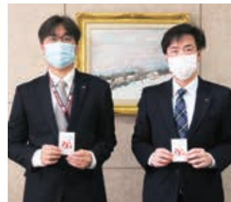
参加賞として共同募金のクオカードを 活用いただきました。 (神戸日野自動車株式会社本社にて)

から募金に協力 いただけるとい う、グッズ募金 の新しいスタイ ルとなりました。 ご協力に感謝を 申し上げます。