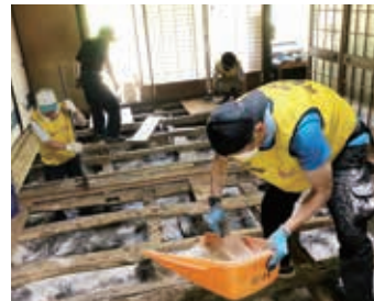
平成30年7月豪雨災害でのボランティア活動の様子(宍粟市)