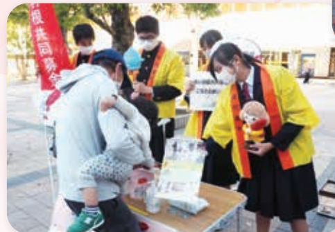
街頭募金の様子（神戸市須磨区）