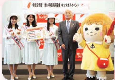
キックオフイベント（神戸市中央区）