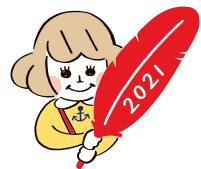
兵庫県オリジナルバッジ

あかはねちゃんは、 大きな赤い羽根をもった女の子。 共同募金をみんなに知ってもらうために、 兵庫県内でPR活動をしています。 見かけたら声を掛けてね！