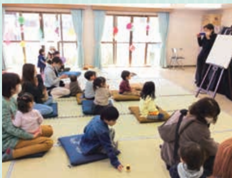
親子参加のイベントが催されている様子

また、「まちの子育てひろば」や「子育て自主グループ」は、地域で子育て中の親子が気軽に集まって、子育ての悩みを話し合うなど、親同士の交流の場ともなっています。今後も共同募金を活用し、地域の子育て支援を進めていきます。