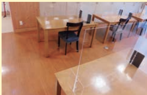
播磨同仁学院 (加古川市)

入所している子どもや母子を新型コロナウイルス感染症から守るため、赤い羽根福祉基金の助成金を活用して、県内12の社会福祉施設に食堂のアクリルパーテーションや空気清浄機、体温測定カメラなどが設置されました。