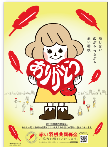
令和3年度 兵庫県共同募金会 オリジナルポスター