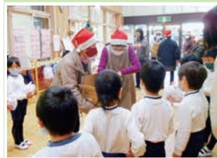
こども園児と地域高齢者のクリスマス交流会を実施しました。(明石市)