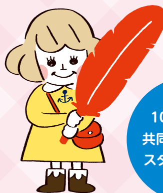
兵庫県共同募金会マスコット あかはねちゃん