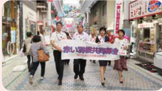
▲水道筋パレードの様子(神戸市灘区)