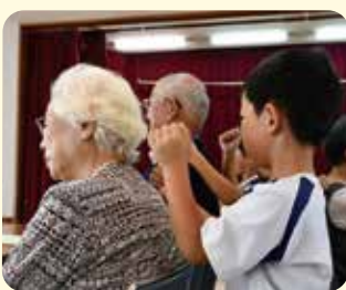
幼稚園児や小学生からの肩たたきに会場も和やかな雰囲気