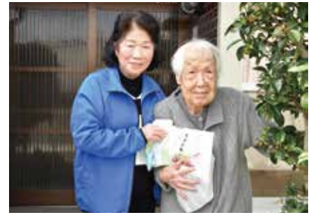
高齢者宅へ手作りのお弁当やお菓子等をお届けする友愛訪問を実施しました。(赤穂市)