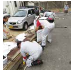
平成30年7月豪雨災害での ボランティア活動の様子(神戸市灘区)