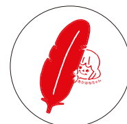
兵庫県オリジナルバッジ

あかはねちゃんは、大きな赤い羽根をもった女の子。共同募金をみんなに知ってもらうために、兵庫県内でPR活動をしています。見かけたら声を掛けてね。