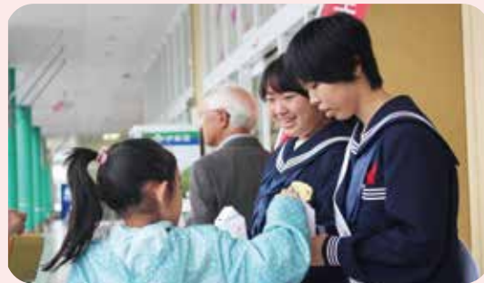
▲募金活動の様子(香美町)