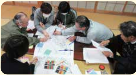
地域住民で情報を交換しながら作成する「福祉マップ作り」の様子