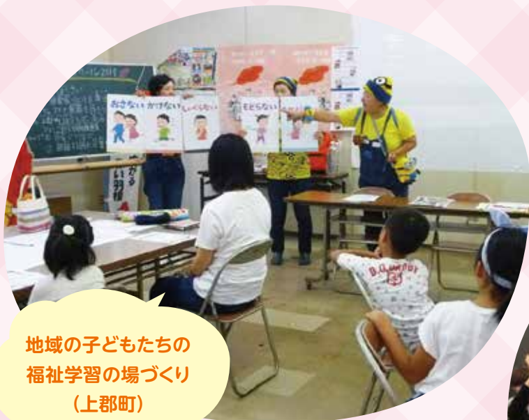
地域の子どもたちの 福祉学習の場づくり (上郡町)