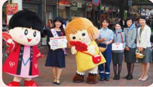
▲キックオフイベントと街頭募金(神戸市長田区)