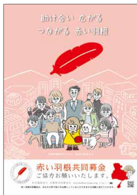
令和2年度 兵庫県共同募金会 オリジナルポスター