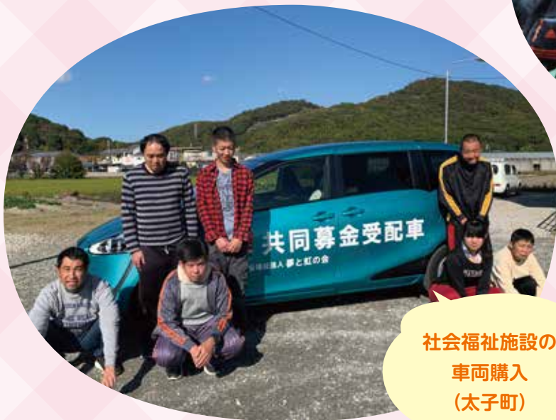
社会福祉施設の 車両購入 (太子町)