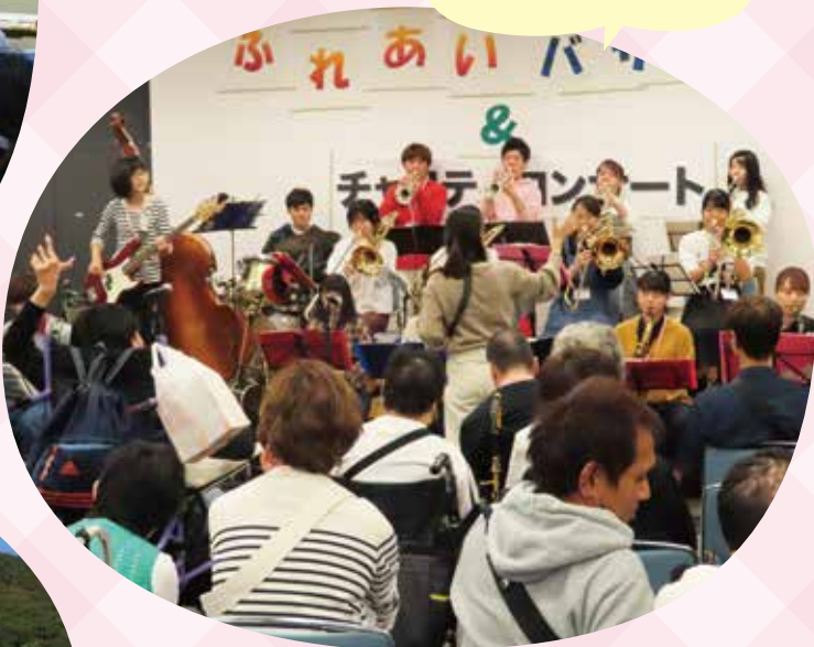
障害に対する 理解促進・交流事業 (神戸市中央区)