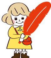
兵庫県共同募金会マスコット あかはねちゃん